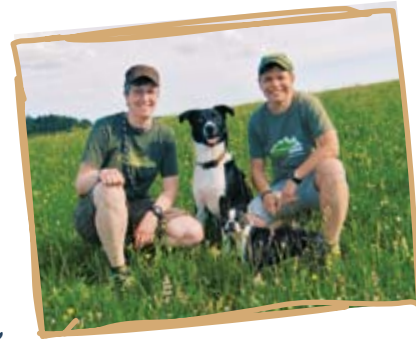
„Gipfelhund“ Piero (rechts) ist immer mit dabei

Buchung und Kontakt: Gipfelhunde Hundewandern, c/o Isarfreude, Humboldtstraße 5, 81543 München, Tel.: 0049 (0)89 52 03 27 27 Mail: info@gipfelhunde.de , www.gipfelhunde.de