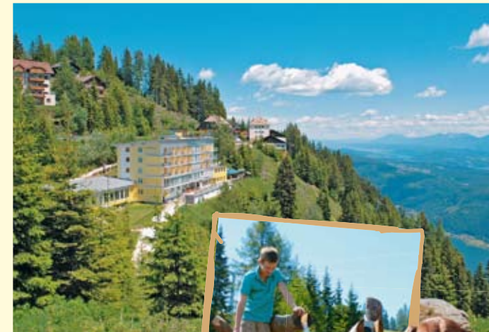
Ein herrlicher Blick wartet auf die Gäste des Sonnenhotels Zaubek ( Foto oben )