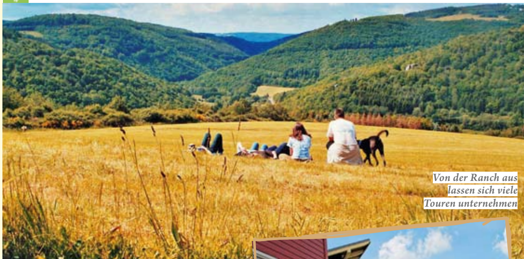
Von der Ranch aus lassen sich viele Touren unternehmen